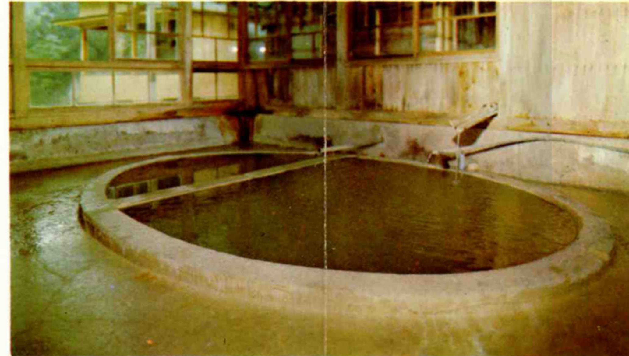
胃腸病・神経痛の湯

温泉らしい温泉だ…とおほめいただけます 温泉は純粋な炭酸泉で、胃腸病・神経痛をはじめ、リュウマチ・高血圧・肝臓病などに特効があります。